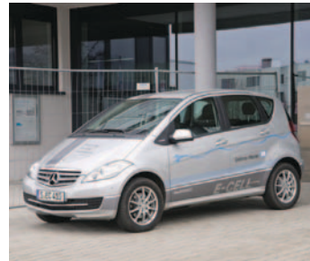
Abb. (v. l. n. r.): Freie Kühlung BHKW Einsatz von Elektrofahrzeugen