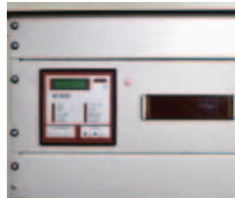
Abb. (v. l. n. r.): Heizungspumpe, Tageslichtröhre, Spitzenlastmanagementanlage